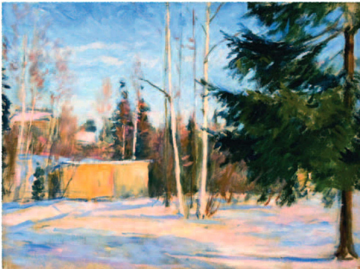
Леонид Казенин. Зимний пейзаж в Абрамцево. 1945

ся на корпоративную социальную ответственность в деле достижения определенных политических целей. Крупный бизнес бывает очень умен и знает, как отвлекать от себя внимание недовольных и отвергать выдвигаемые обвинения, действуя на опережение и когда надо договариваясь.