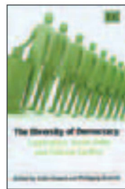
COLIN CROUCH and WOLFGANG STREECK (eds). The Diversity of Democracy: Corporatism, Social Order and Political Conflict . Cheltenham: Edward Elgar, 2006 5

Беседа и перевод с англ. АРТЕМА СМЕРНОВА