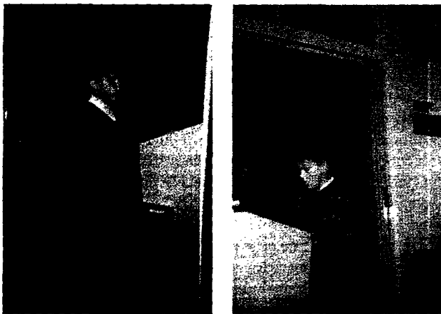
De eerste schreden op het trapharmonium. Links de broer van de auteur. Rechts de auteur zelf.

Voor een deel is die integratieve kracht van ons brein ook de reden voor individuele verschillen in de voorkeur voor muziek. We herinneren ons gebeurtenissen uit de leeftijdsfase tussen 15 en 25 jaar het best. Een van de redenen daarvoor is dat gebeurtenissen in die periode een grotere emotionele lading hebben (de eerste verliefdheid, de eerste auto, etc.). Gebeurtenissen met een emotionele lading blijven beter in het geheugen bewaard. Mijn eerste voorzichtige zoenen, de eerste verliefdheden, vonden plaats tijdens schoolfeestjes met de muziek van de Rolling Stones in de achtergrond. De muziek uit die periode is in mijn geheugen verbonden met de herinneringen uit die tijd, en heeft daardoor een grotere emotionele lading dan muziek die ik hoorde in andere levensfasen. Onderzoek heeft uitgewezen dat auto's beter verkopen wanneer er op de achtergrond muziek te horen is uit de leeftijdsfase tussen 15 en 25 jaar. Voor mij is de muziek van de Rolling Stones daarom 'beladen' met positieve associaties. Mijn ouders daarentegen vonden het vooral herrie. Spirituele muziek is voor een niet onaanzienlijk deel dan ook spiritueel vanwege de context waarin deze muziek gehoord werd of wordt, en waarmee de klanken in ons brein onlosmakelijk verbonden zijn geraakt. Het gregoriaans ontleent een deel van zijn spiritualiteit aan het feit dat deze muziek meestal in de kerk gehoord wordt en niet op Lowlands.