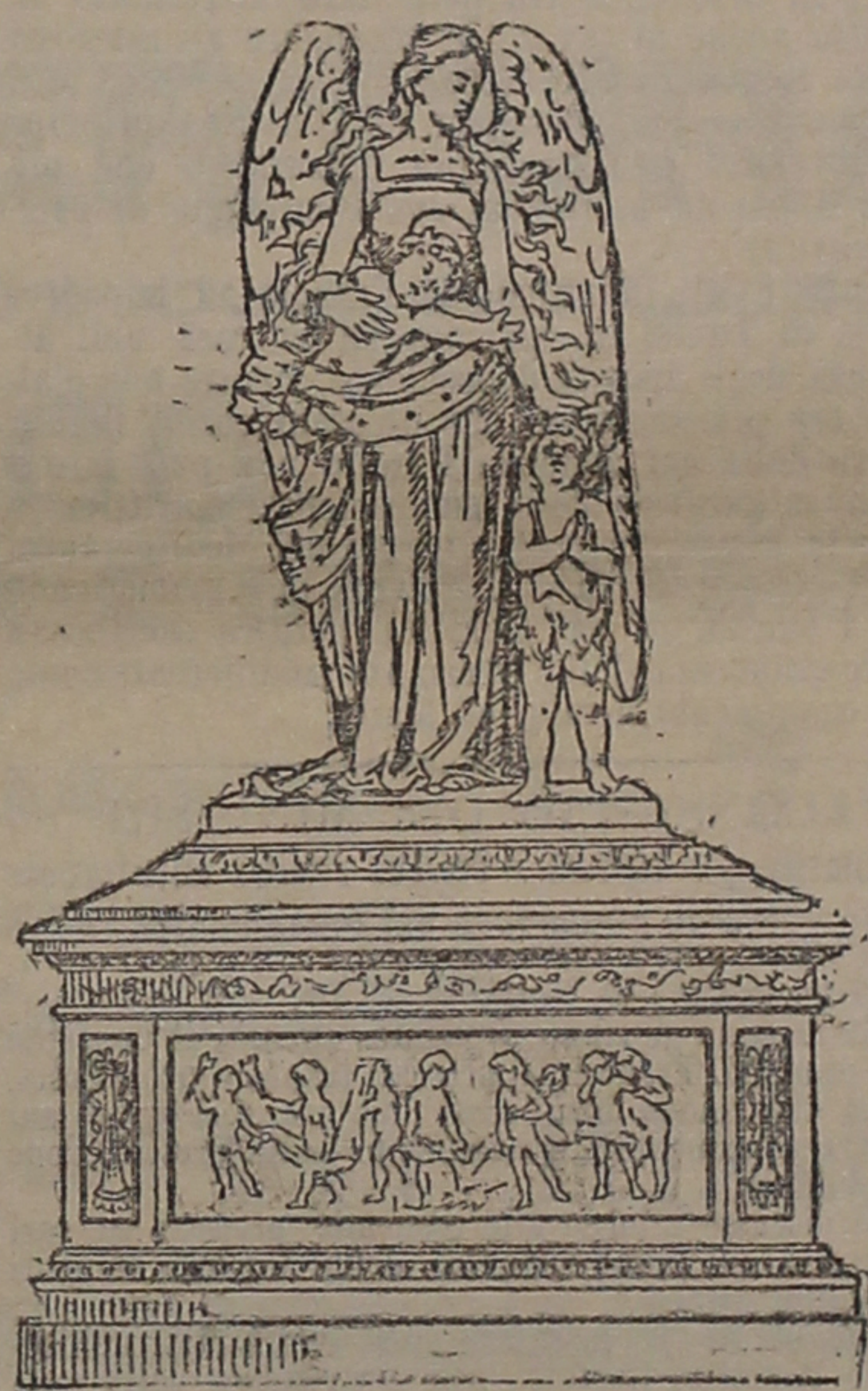
Gruppo monumentale nella cappella Gancia

Il fabbro sorge sopra un piedistallo semplicissimo di ravaccione portante nella fronte del dado un me-