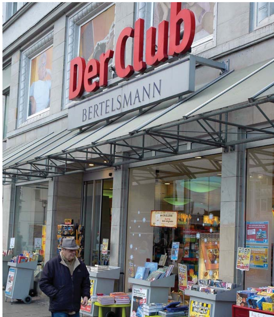
Der Bertelsmann Club hatte in den 1980er-Jahren sechs Millionen Kunden allein in der Bundesrepublik. Nach Expansion in die Gebiete der ehemaligen DDR wuchs die Mitgliederzahl noch einmal an, sank danach aber stetig. Bei nurmehr etwa einer Million Kunden hat Bertelsmann die Einstellung des Clubs zum Ende des Jahres 2015 angekündigt. Filialen – hier 2008 in Bielefeld – gibt es schon seit März 2015 nicht mehr.

Sowohl in Europa als auch in den USA stellte eine neue Generation verkrustete gesellschaftliche Strukturen infrage. Sie hatte als erste in der Breite sekundäre Schulbildung genossen und war in Wohl-