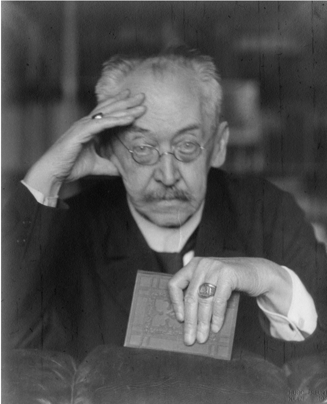
Abb. 1.1: Adolf von Harnack, ca. 1912.

dem Breslauer Zoologen und Taxonomen Thilo Krumbach (1874–1949) geleitet wurde. Im Januar 1913 eröffnete die Kaiser-Wilhelm-Gesellschaft dank einer Schenkung der jüdischen Kunstmäzenin Henriette Hertz (1846–1913) ihr erstes geisteswissenschaftliches Institut im legendären Palazzo Zuccari in Rom: die Bibliotheca Hertziana , eine kunsthistorische Forschungsbibliothek, deren Schwerpunkte auf der Erforschung der italienischen und römischen Kunst der Nachantike und insbesondere der Renaissance und des Barock lagen. 16 Dies geschah zu einem Zeitpunkt, an dem die Kunstgeschichte als Disziplin noch in den Kinderschuhen steckte. Hertz hatte 1897 in Florenz die Bekanntschaft des jungen Kunsthistorikers Ernst Steinmann (1866–1934) gemacht, der sie zur Gründung eines kunst-