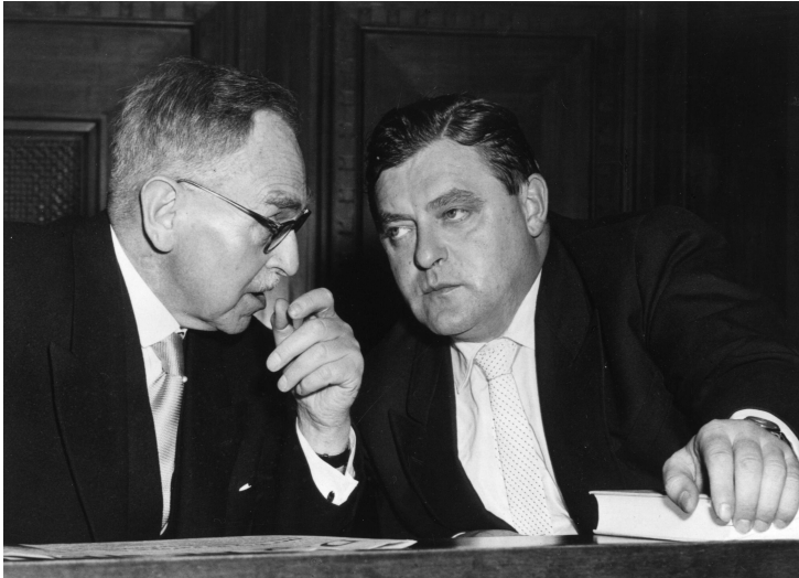
Abb. 1.8: Otto Hahn und der Bundesminister für Atomfragen Franz Josef Strauß am 1. Oktober 1956 auf einer außerordentlichen Sitzung des Berliner Abgeordnetenhauses, auf der es um den Ausbau der Kernforschung an (West-)Berlins Universitäten sowie die Gründung eines Instituts für Kernforschung ging. Hahn referierte über „Die Bedeutung der friedlichen Nutzung der Kernenergie für die Zukunft“.

Ende 1956 zeigte sich der Arbeitskreis „Kernphysik“ beim damaligen Bundesministerium für Atomfragen tief beunruhigt über das Bestreben der Bundesregierung, Verfügungsgewalt über Atomwaffen zu erlangen und schrieb einen Brief an den Bundesverteidigungsminister Franz Josef Strauß (1915–1988). 299 Nach einer gemeinsamen Besprechung mit Strauß im Januar 1957 einigte man sich darauf, zunächst noch nicht an die Öffentlichkeit zu treten. 300 Doch Adenauers Erklärungen vor der Presse im April 1957 zur geplanten Atombewaffnung der Bundeswehr und die dabei erfolgte Gleichsetzung von taktischen Atomwaffen mit konventionellen Waffen veranlassten die Wissenschaftler – allen voran Hahn und von Weizsäcker – erneut das Wort zu ergreifen. Am 12. April 1957 wurde die Göttinger Erklärung der Öffentlichkeit übergeben. 301 Wichtige Aspekte