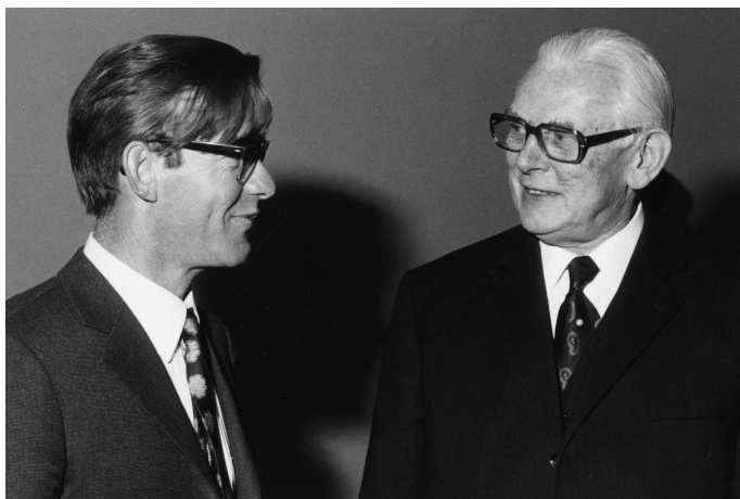
Abb. 1.9: Generationswechsel: Reimar Lüst und Adolf Butenandt.

ckelten sich die Empfehlungen für eine zeitliche Begrenzung der Leitungsfunktion der Direktoren, eine regelmäßige Evaluierung der Institute durch von in- und ausländischen Wissenschaftlern besetzte Fachbeiräte, Mitwirkungsrechte für alle angestellten Mitarbeiter – jedoch keine Mitbestimmung im Sinne demokratischer Entscheidungsprozesse etwa für Forschungsrichtungen und -methoden. Für die weitere Entwicklungsplanung der Max-Planck-Gesellschaft sollte dem Präsidenten ein Senatsausschuss für Forschungspolitik und Forschungsplanung zur Seite gestellt werden. Die Kommission vertrat den Standpunkt, dass die Mitarbeiter der Institute nicht nur in den Senat gehörten, sondern von jedem Institut auch ein Mitarbeiter oder eine Mitarbeiterin in der jeweiligen Sektion vertreten sein sollte – ein Vorschlag, der die Kluft zwischen Reformgegnern und -befürwortern noch weiter vertiefte. Dennoch stimmte am 15. März 1972 der Senat dem neuen Strukturkonzept grundsätzlich zu, dass daraufhin dem Wissenschaftlichen Rat vorgelegt wurde.