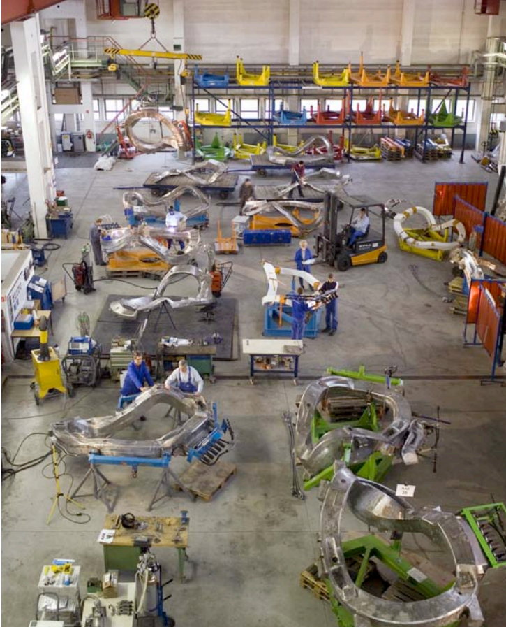
Abb. 2: Endfertigung der Magnet- spulen bei der Babcock Noell Magnet- technik GmbH in Zeitz

Während in den Vormontageständen Ia und Ib nun fast schon routinemäßig die nächsten zwei Halbmodule entstehen, warten im Vormontagestand II neue Herausforderungen: Wenn hier die beiden Teile des Tragrings ausgerichtet und miteinander verschraubt sind, die Plasmagefäß-Teile verschweißt und die thermische Isolation an der Nahtstelle geschlossen, ist das erste der fünf Module im Rohbau fertig. Nun müssen die Leiter für die elektrische Verschaltung der Spulen angebaut werden – ein recht schwieriger Arbeitsgang. Die steifen, bis zu 14 Meter langen Supraleiter, die vom Forschungszentrum Jülich hergestellt werden, sind bereits in die richtige Form gebogen. 24 Stück der unhandlichen, aber empfindlichen Leiter werden pro Modul gebraucht. Nach dem elektrischen Verbinden und Verschweißen der Supraleiter werden die Verbindungsstellen hochspannungsfest isoliert und ihre Heliumdichtigkeit kontrolliert. Parallel dazu läuft – auf mittlerweile engstem Raum – die Verrohrung für die Helium-Kühlung der Spulen. Alles ist auf Leckdichtigkeit zu prüfen. Sind nun noch Sensoren und Messkabel verlegt, kann – gemäß Planung nach rund 25 Wochen Bauzeit – das erste Modul den Montagestand II verlassen.