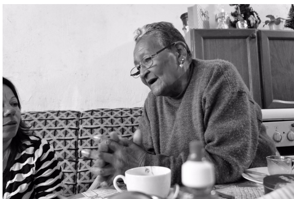
Figura 2 – A contadora de histórias, junho de 2013.

Mas na Botafogo a gente fervia Eu fui também, aluguei uma pecinha pra mim, Mas não com eles, eu morei sozinha! Sempre sozinha! A gente ia pra festas, ia pra baile, eles iam Às vezes eu acompanhava Ficava lá sentada na mesa, olhando Aí ia pro barzinho Ali a gente se divertia, na Botafogo 5