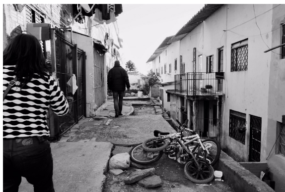
Figura 3 – A caminho de casa, junho de 2013.