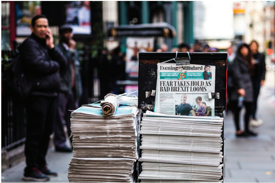
Auf eine Krise folgt nicht immer Optimismus: Der Brexit-Entscheid und die nachfolgenden Kontroversen waren geprägt von Zukunftsängsten und dem nostalgischen Wunsch, die Vergangenheit aufleben zu lassen. Vom britischen Glauben an eine bessere Zukunft scheint durch den anhaltenden Krisenmodus nicht mehr viel übrig zu sein.

den. Gelingt es, die Unbestimmtheit der Zukunft nicht mehr als Unsicherheit, sondern als Offenheit zu begreifen und dabei eine Vorstellung von Zukunft zu etablieren, die weite Teile der Bevölkerung teilen, kann ein gesellschaftliches Klima des Aufschwungs entstehen. Krisen gehen dann in eine Phase der Zuversicht über. Abbildung 1 zeigt entsprechend, dass der Krise vom 11. Septembers 2001, der Finanz- sowie der Staatsschuldenkrise jeweils Phasen folgten, in denen viele Briten wieder an eine stabile oder gar bessere wirtschaftliche Zukunft glaubten. Den Krisen folgte Optimismus.