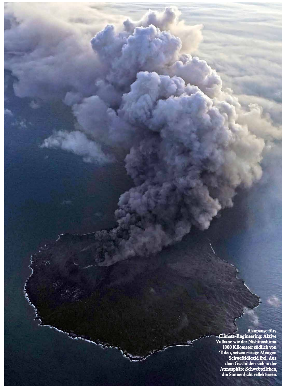
Blaupause fürs Climate-Engineering: Aktive Vulkane wie der Nishinoshima, 1000 Kilometer südlich von Tokio, setzen riesige Mengen Schwefeldioxid frei. Aus dem Gas bilden sich in der Atmosphäre Schwebeteilchen, die Sonnenlicht reflektieren.