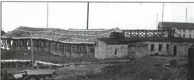
Abb.2: Durch Thermokarst verbogene Treibhausruine in Tiksi (sibirische Arktis).

Als Grundlage für diese Aussage dienen unzählige Daten und wissenschaftliche Erkenntnisse. In den letzten Jahren sind keine Forschungsergebnisse publiziert worden, die den Einfluss der Menschheit auf das Klima in Frage stellen. Im Gegenteil, die o.g. Fakten werden weiter erhärtet. Gelegentlich werden in der Presse gegenteilige Aussagen verbreitet, die jedoch nicht in begutachteten wissenschaftlichen Fachzeitschriften veröffentlicht worden sind. Außerdem finden oft auch »Gespensterdiskussionen« in den Medien statt, die losgelöst von den wissenschaftlichen Fakten sind und zur Verwirrung und Desinformation der Öffentlichkeit führen.