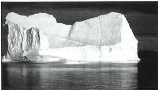
Abb. 1: Eisberg, Disko-Bucht, Grönland.

Auch im globalen Strahlungshaushalt hat das polare Eis eine herausragende Bedeutung. Die Albedo des Eises, d.h. das Reflexionsvermögen gegenüber der Sonneneinstrahlung im sichtbaren Wellenlängenbereich (0,4–0,7 µm), liegt zwischen 0,5 (schneefreies bzw. schmelzendes Eis) und 0,85 (mit Neuschnee bedecktes Eis), während die Albedo des eisfreien Ozeans unter 0,1 liegt. Das bedeutet, dass die Eisdecke den Eintrag an kurzwelliger Strahlungs-