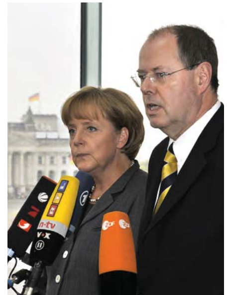
Im Herbst 2008 versicherten Bundeskanzlerin Angela Merkel und Finanzminister Peer Steinbrück den Deutschen in einer Pressekonferenz, dass der Staat für ihre Depoteinlagen garantieren würde. Erzeugt wurde – erfolgreich – die Erwartung, dass die Spareinlagen bei den Banken weiterhin sicher seien. Verhindert wurde ein Bank Run. Ein Beispiel für die Politik der Erwartungen.

Erwartungen unter Bedingungen von Ungewissheit lassen sich als fiktional bezeichnen. Fiktional meint hier nicht, dass die Vorstellungen per se falsch wären; sie lassen sich nur nicht empirisch verifizieren, zumindest solange die Zukunft noch nicht zur Gegenwart geworden ist. Die gegenwärtigen Vorstellungen von Akteuren hinsichtlich zukünftiger Zustände der Welt sind in dem Sinn fiktional, dass sie eine neue, eigene Realität schaffen. Entscheidungen unter Bedingungen von Ungewissheit beruhen auf Imaginationen und Projektionen, von