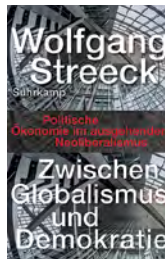
Wolfgang Streeck „Zwischen Globalismus und Demokratie“ Suhrkamp, Berlin 2021. 538 Seiten, 28 €

Meine These ist: Ein in eine internationale Friedensordnung eingebetteter, souveräner, nicht zu großer Nationalstaat ist das einzige politische Gebilde, das demokratisierbar ist, also verpflichtet werden kann, die Interessen nichtelitärer Bevölkerungsmehrheiten mittels Rückbettung seiner politischen Ökonomie in die sie tragende Gesellschaft zur Geltung zu bringen.