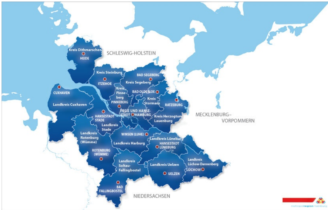
Abb. 1.3 Karte der Metropolregion Hamburg mit den dazugehörigen Landkreisen in Schleswig-Holstein und Niedersachsen

man sich dabei im Wesentlichen auf das Geschehen in der bodennahen Atmosphäre (z. B. Lufttemperatur und Feuchte) und benutzte diese, um anhand langjähriger Mittelwerte regionale Aspekte (z. B. Tropen und polare Gebiete) zu unterscheiden. In den letzten Jahrzehnten hat sich das Klimaverständnis wesentlich erweitert. Zum einen begann man zu verstehen, dass Klima nicht konstant ist, sondern ebenfalls erheblichen Schwankungen im Laufe der Zeit unterliegt; zum anderen realisierte man, dass sich Klima nicht nur in der Atmosphäre abspielt, sondern durch Wechselwirkungen mit anderen Komponenten des Klimasystems (wie z. B. den Ozeanen oder den Eismassen) geprägt wird.